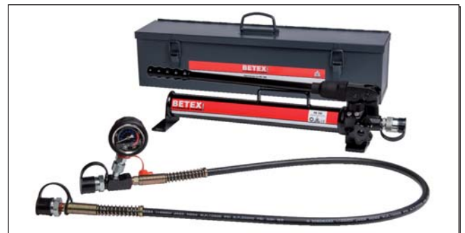
Combi-Satz PB 700