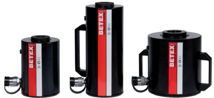
Modell ACHC 30-60T